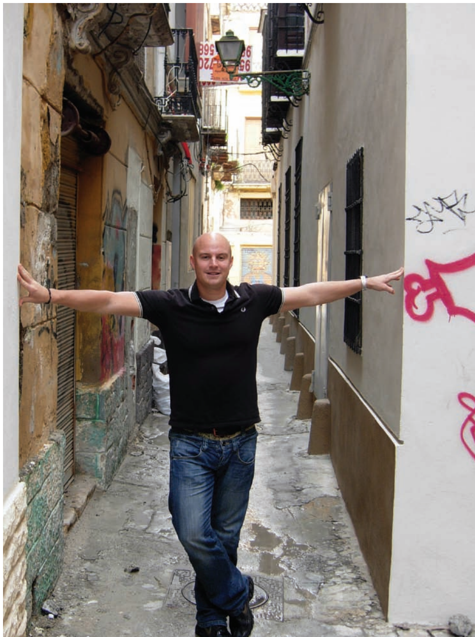
Han kommer til sin lejlighed ad smalle gyder.

Bor i Málagas gamle by på 13. år. Fast spansk kæreste, ingen børn. Dyrker meget sport, rejser meget – ikke mindst til Rio de Janeiro - og har stor interesse i spanske samfundspolitiske forhold.